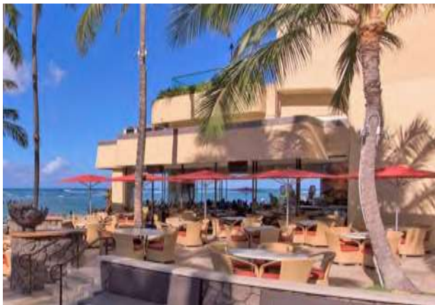
Upper Diamond Head Patio ダイヤモンドヘッド・パティオ上段