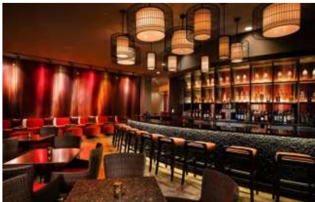
New Lounge area ラウンジエリア