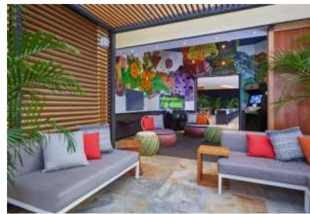
VIP Cabana & Game Room VIP カバナ