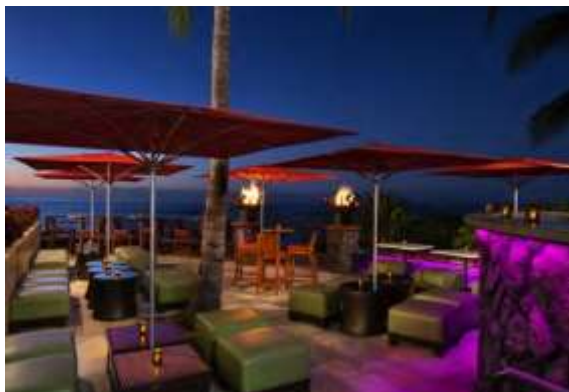
Lower Ewa Patio エヴァ・パティオ下段