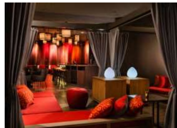
Ocean side Cabana

収容人数 120 名 ダイヤモンドヘッド・パティオのエリアの全貸切となります。他のお客様がいらっしやらず、まったくのプライベートな空間となるので、エンターテインメントや AV 機器のアレンジが可能です。お客様の思い通りのパーティーが可能です。