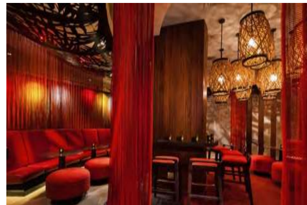
RumFire inside (only included in a buyout) ラムファイヤー屋内(全貸切のときのみ含まれます)