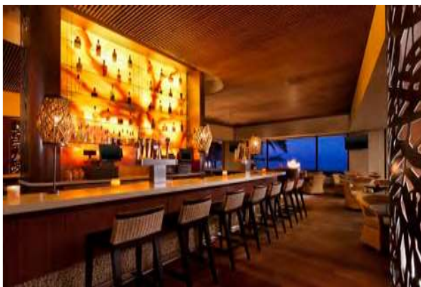
Main Bar (only included in a buyout) メンバー(全貸切のときのみ含まれます)