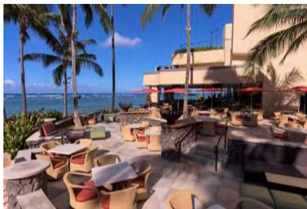
Lower Diamond Head Patio ダイヤモンドヘッド・パティオ下段